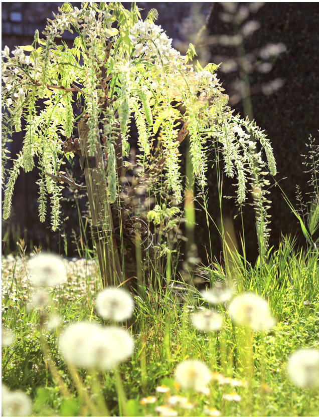
Le parc du château est désormais ouvert tous les jours de 9 h à 18 heures.

Contact : 04 92 92 47 21 ou maison-bleue@mouans-sartoux.net