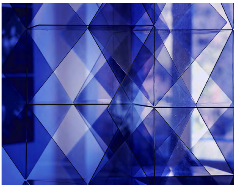
Œuvre Transformation instable juxtaposition superposition (détail), 1966. Collection Famille Sobrino.