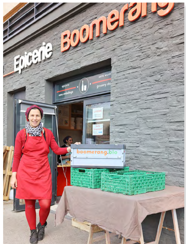
L'épicierie Boomerang propose un drive de produits en vrac