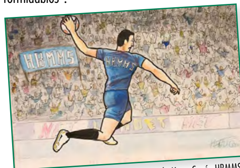
Dessin de Manu Coué - HBMMS

Toutes les catégories de population, tous les âges se mobilisent. Parmi tant d'autres, signalons l'initiative des handballeurs du HB Mouans-Mouans-Sartoux qui proposent de réaliser et d'offrir des dessins aux personnes placées en confinement dans leur chambre de maison de retraite. Les Mouansoises et Mouansois sont formidables !